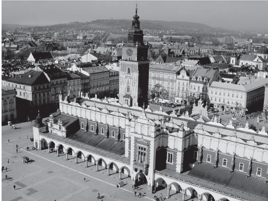
Die Stadt Krakau in Südpolen: Blick auf den Marktplatz mit Rathausturm und den Tuchhallen.

durchschnittliche Wirtschaftswachstum lag 1996 bis 2005 bei 4.4 % pro Jahr; dasjenige der Schweiz bei 1.5 %. Wir exportieren derzeit jährlich für 4 Milliarden Güter in die neuen EU-Länder, wobei dieser Betrag jährlich um 10 % wächst. Bei einem Nein verpassen wir eine Chance und strapazieren die guten Beziehungen zur EU.