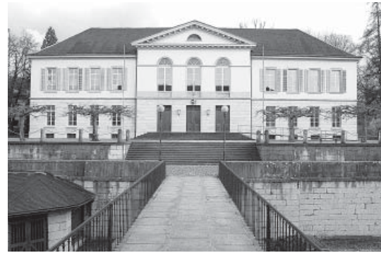
Das Grossratsgebäude in Aarau.

Gepflegt werden von der Ratsleitung auch Kontakte mit anderen