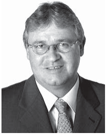
Markus Zemp, Nationalrat