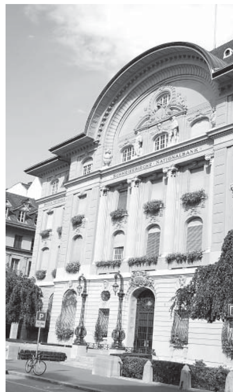
Die Schweizerische Nationalbank

Zudem: Die AHV kann mit KOSA nur dann gesichert werden, wenn die Nationalbank anhaltend extrem hohe Gewinne erwirtschaftet. Doch das ist eine Illusion. Die National-